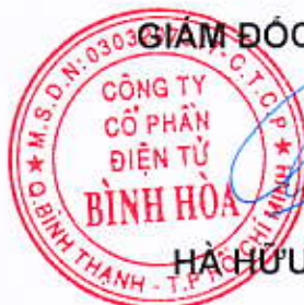
HÀ HỮU QUANG